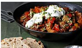
FürSie Omas Kartoffelgulasch