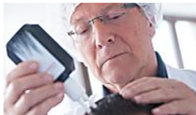
Thiocyanat "Es gibt keinen Anhaltspunkt dafür...