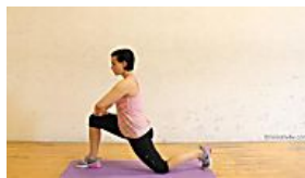
Vital Fitnessliebe Fitness-Übung:Stretching...