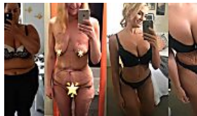
BUNTE Sie hat 92 Kilo abgespeckt!