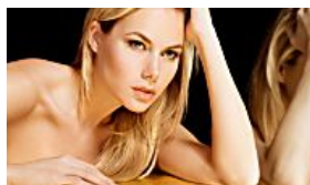
Selbstwahrnehmung Selbstwahrnehmung Warum wir besser...