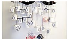
FürSie Weihnachten Adventskalender zum...