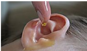
123-lifehacks.com 12 Erstaunliche Nutzungsmöglichkeiten...