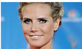
Promi-Haare Promi-Haare Heidi Klums Frisuren